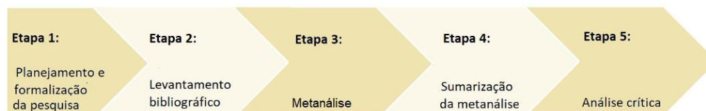
Figura 1 – Etapas da Revisão Sistemática de Literatura Fonte: Adaptado de Munzlinger, Narcizo e Queiroz (2012, p. 52).

Por sua vez, a RSL foi desenvolvida em cinco etapas básicas, as quais obedecem ao Protocolo de Estudo, conforme apresentado na Figura 1.