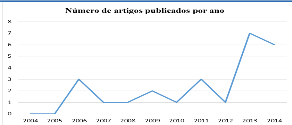
Gráfico 1 – Número de artigos publicados por ano