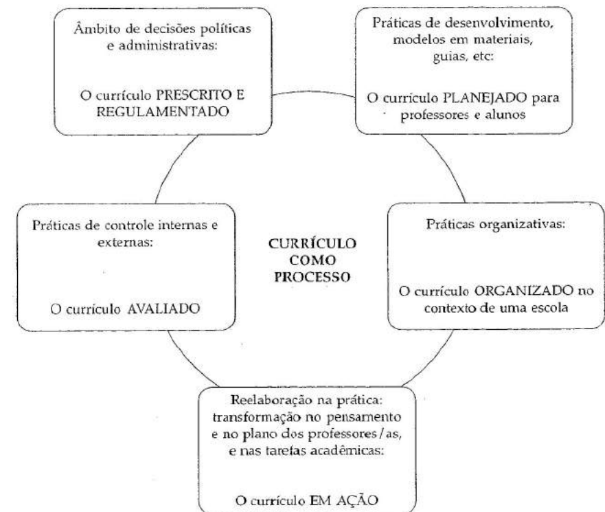
Figura 6.2. O currículo como processo.

Poderia se analisar um currículo a partir dos documentos legais ou orientações que a administração elabora, nos moldes que uma editora de livros-texto faz do conhecimento e dos objetivos educativos, por exemplo. Um retrato mais real do que é a prática nos darão os planos que as equipes de professores/as elaboram numa escola ou os que estes professores/as fazem em suas aulas para seus alunos/as. Os trabalhos acadêmicos que estes realizam, os exames que o professor/a impõe, nos quais se valorizam certos conhecimentos adquiridos e reproduzidos de forma singular, ou os que se valorizam em provas externas, serão um indicador muito decisivo para saber o que se sugere e obriga a aprender e como fazê-lo. Uma coisa não é independente totalmente da outra, mas o certo é que são fases no processo de concretização das expectativas curriculares que dão significados particulares às idéias e às propostas. Em que modelos são concretizadas essas transformações quando nos referimos ao currículo? Em todas elas se expressa de forma distinta o currículo, a realidade deste é o resultado das interações em todo esse processo, tal como demonstra a Figura 6.2.