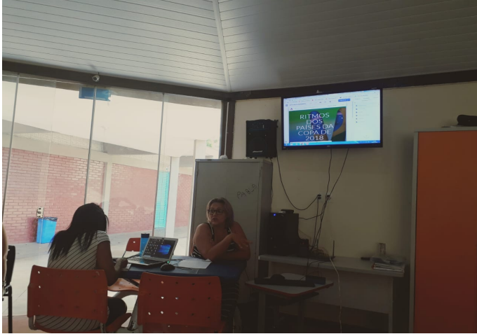
Figura 5 – Participante apresentando a sua Webquest ao grupo