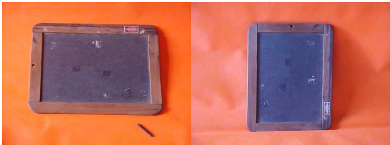
Figura 1 - Lousa de ardósia individual do aluno com lápis de ardósia