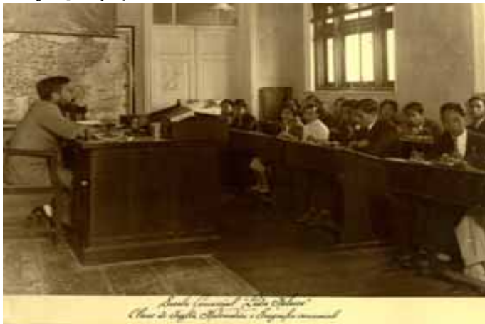
Figura 4 - Disposição do mobiliário escolar de uma sala de aula no início do século XX

Fonte: imagem de internet. Disponível em http://www.fitini.net/escolacomercial/historia.html