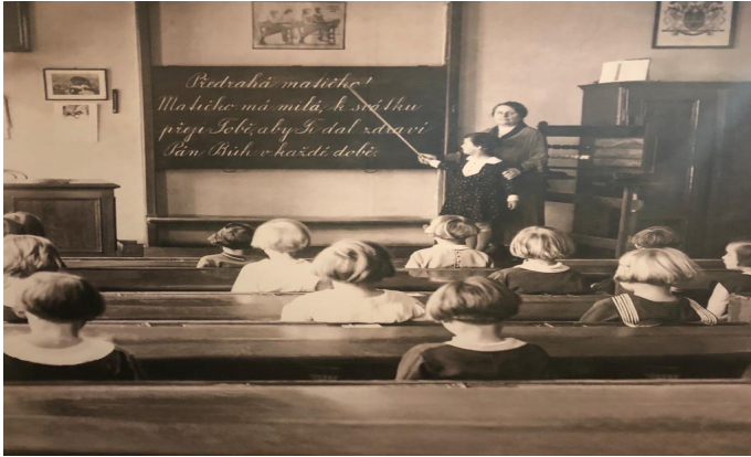
Figura 2 – Sala de aula com suporte do quadro-negro nos anos de 1930.