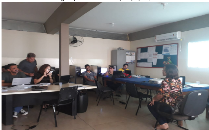
Figura 7 - Oficina de Motivação e preparação

Na primeira oficina, os professores puderam experimentar as tecnologias em duas situações: no papel de estudantes e no papel de professores. Na primeira situação, a formadora simulou que os participantes eram seus estudantes e preparou um game no aplicativo Kaout em que todos foram incentivados a baixar nos seus celulares e participar. O Kahoot é uma plataforma de ensino gratuita que funciona como um gameshow . Os professores criam questionários de múltipla escolha (sempre com 4 opções) e os estudantes participam online, cada um com seu dispositivo (computador, tablet ou celular). O Kahoot classifica os participantes que acertaram mais questões em menos tempo, assim quem participa da atividade sente-se motivado a competir por uma posição melhor, princípio da gamificação da qual os estudantes em geral sentem-se motivados a participar. Os resultados com estes professores foram surpreendentes, eles ficaram muito interessados no aplicativo e em como poderiam usar com seus estudantes.