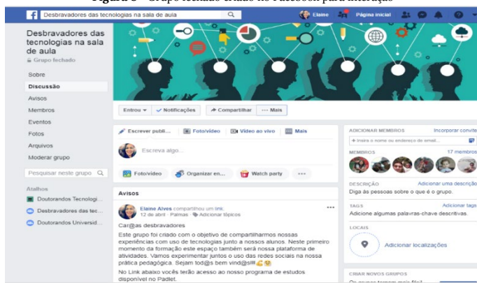
Figura 8 - Grupo fechado criado no Facebook para interação

consideravam interessantes para compartilhar com colegas. Considerando a pesada carga horária de trabalho destes professores, a participação neste grupo foi mínima. No entanto, todos os dias a formadora compartilhava novos recursos, metodologias e ferramentas web voltadas para a tecnologia educacional e observava que os participantes visualizavam as postagens. O objetivo do grupo na rede social foi criar um espaço informal de troca de experiências e cultivar uma cultura de compartilhamento de conteúdos que discuta as tecnologias educativas entre os professores.