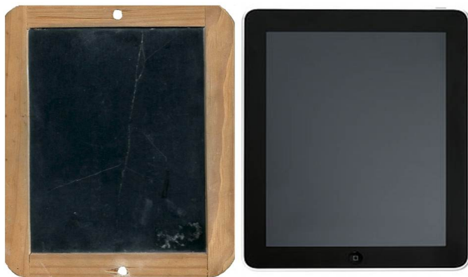
Figura 5 - Analogia do quadro-negro com o tablet