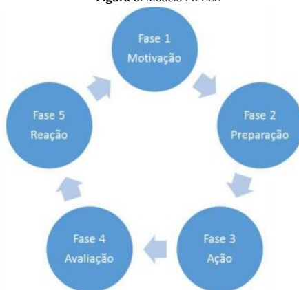
Figura 6: Modelo FIPELD

O modelo FIPELD parte da premissa de que o professor deve tomar partido das TDIC para sua autoformação, mas com foco na aplicação destas na sua prática pedagógica junto a seus estudantes de forma integrada. A FIPELD sugere que os professores compreendam que as TDIC não são apenas ferramentas para se chegar a um meio, mas “processos a serem desenvolvidos” (CASTELLS, 1999, p. 51). Quando se fala em evolução, pensa-se em processo. Portanto, a formação para a literacia digital deve ser evolutiva e processual tendo em vista que o processo de apropriação das tecnologias pelos professores é gradual, sujeita a diferentes variáveis e requer tempo para ser assimilado nas práticas docentes. Não se trata de um curso específico de formação de professores para o uso das tecnologias. A proposta FIPELD corresponde a um modelo referencial que pode ser adaptado para oficinas em grupos de professores de uma escola ou mesmo uma formação maior para uma rede de ensino. O modelo FIPELD é cíclico, portanto, evolutivo e permanente, conforme representado na figura 6.